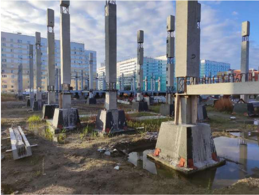
В осях 4-16/П-А