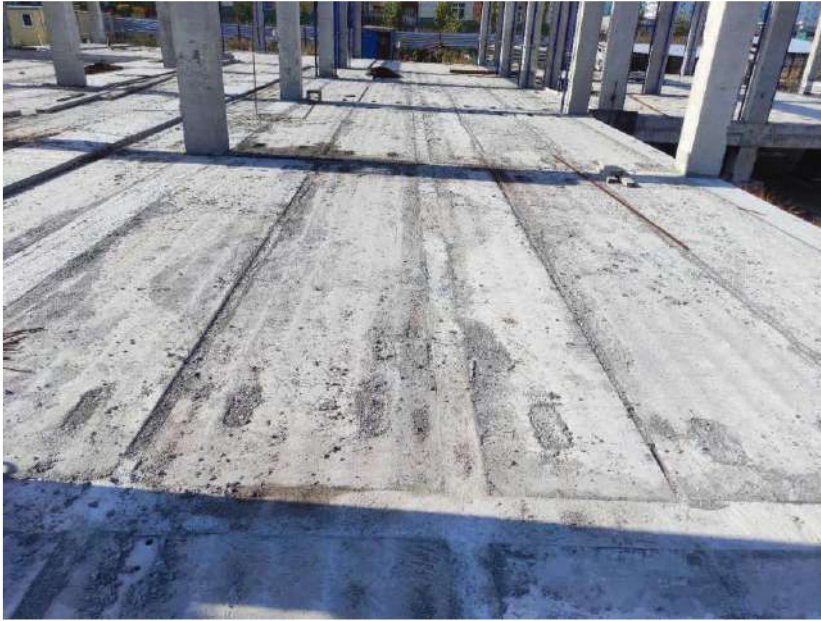
в осях 12-16/Е-А