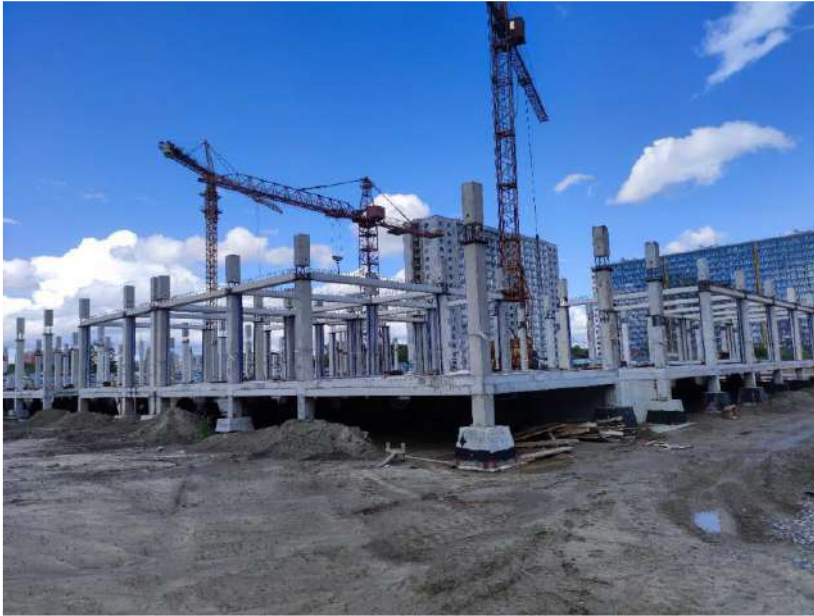
В осях 1-16/А-Т