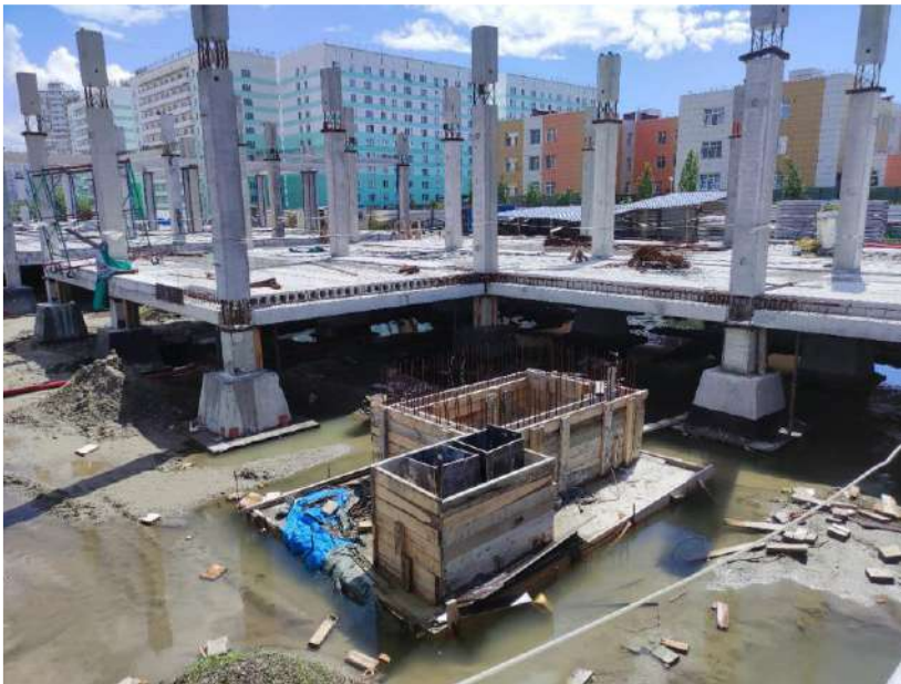
В осях 5-11/А-Г