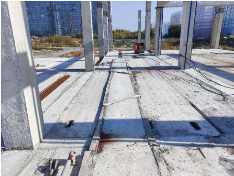
В осях 12-16/Е-Л/1